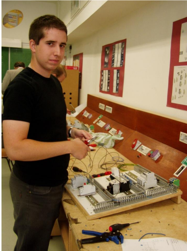
Tervrajz alapján villamos áramkör megvalósítása