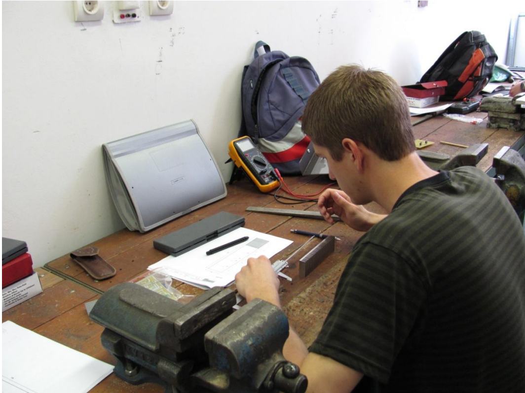
Hűtőelem méretre alakítása, tervezése