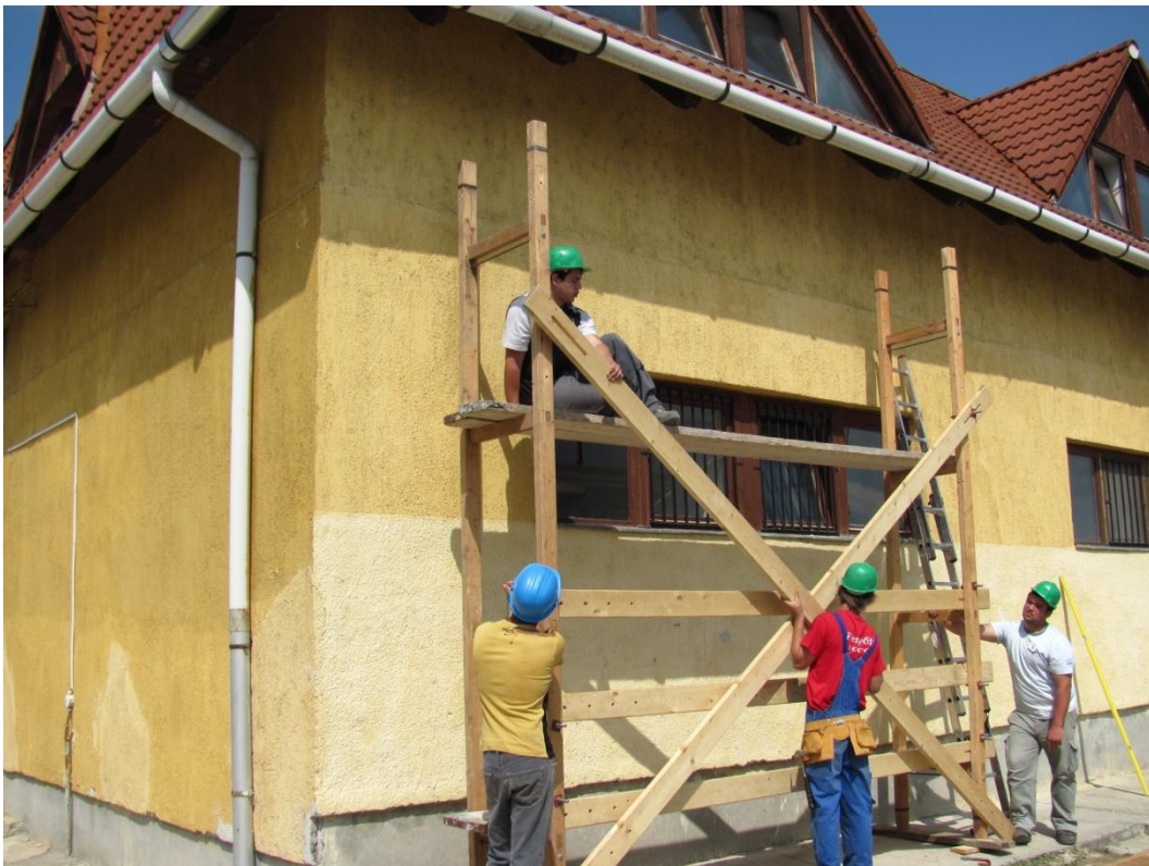
Hagyományos falétraállvány készítés