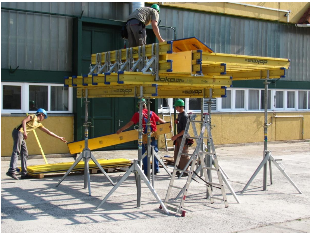
Doka alubordás födémkészítés