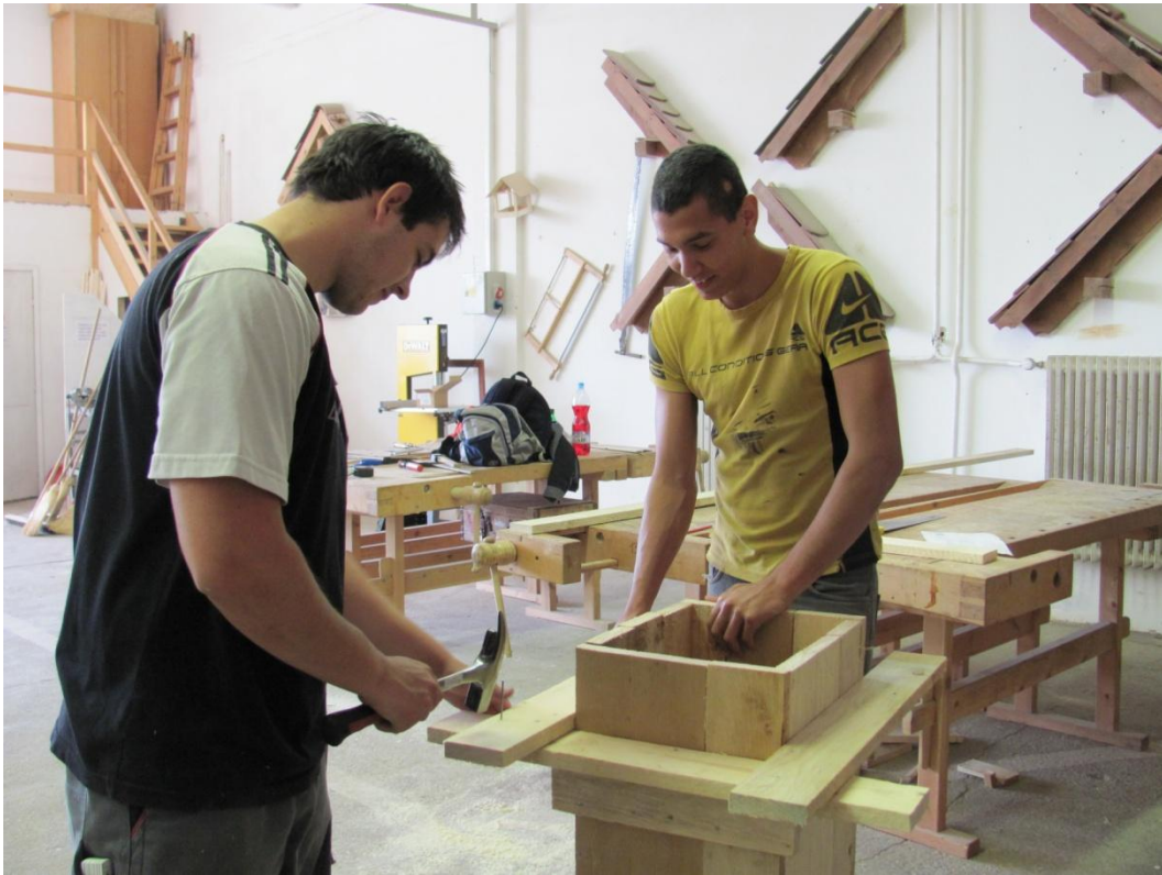
Hagyományos pillér zsalu készítése